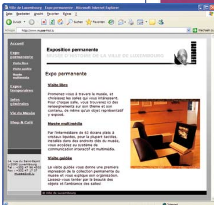
www.musee-hist.lu Musée d'histoire de la Ville de Luxembourg

flexible Designgestaltung basierend auf Internetstandards